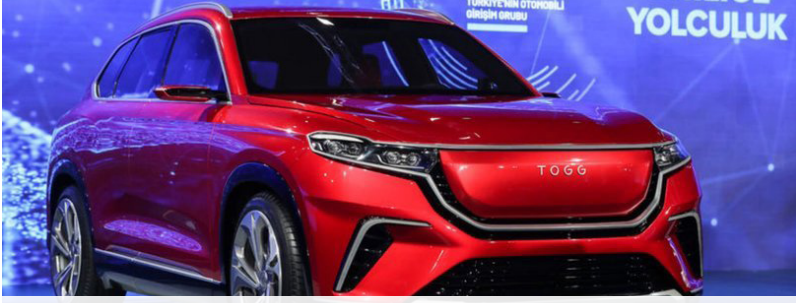
Gebze'de görüciye çıkartmak için tasarımının ve üretiminin yapıldığı İtalya'dan getirtilen "yerli" otomobiller

Yabancı sermaye ile yerli otomobil nasıl üretilir? Turkcell büyük hissesiyle İsveçli TeliaSonera'nın, Kök Ulaşım Lüksemburg merkezli Silcolux yatırım şirketindedir. BMC ise kamuoyu tarafından artık bilindiği gibi Katar sermayelidir. Ayrıca borsaların ülkeler üzerindeki emperyalist tahakkümün başlıca aracı olduğu unutulmamalıdır ve bu şirketlerin halka açık hisselerinin de ortalama yüzde 65'i yabancıların elindedir.