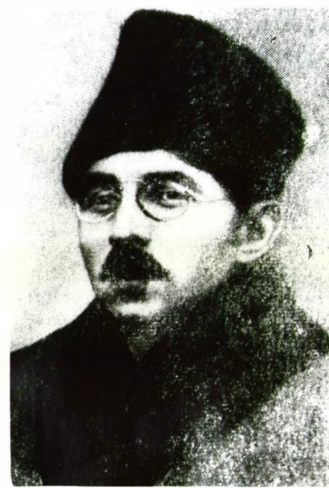
DEVLET ARŞİVLERİ GENEL MÜDÜRLÜĞÜ KOMÜNİST ARŞİVİ

İkinci yüzyıla yeni bir partiyle başlıyoruz. İşçi sınıfımızın yolu açık olsun!