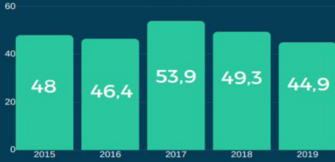
2009-2019 Yılları Arası Türkiye Toplam Doğal Gaz Tüketimi (milyar m 3 )

Karadeniz'de doğalgaz bulunca Türkiye "küresel aktör" oldu diyen de oldu; "yaz kış demeyin artık kombileri sonuna kadar açın" diyen de çıktı! Devlet yetkililerinin Reuters haber ajansına