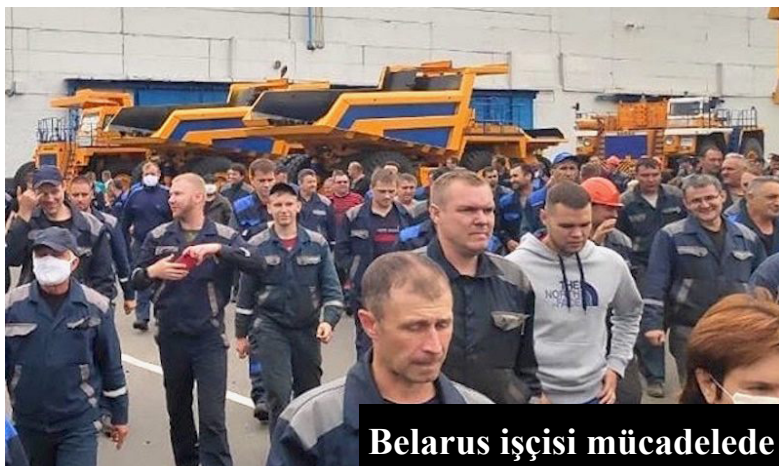
Belarus işçisi mücadelede

Bugün görev, bir yandan Belarus’un emperyalizmin nüfuz alanına girmesini engellemek için mücadele ederken bir yandan da büyük sanayinin işçisini, emperyalizm yanlısı burjuvaziden koparmaktır. Bu ikinci görevi gerçekleştirebilmek için Belarus işçisine muhalefetin Koordinasyonu’ndan farklı bir programla gitmek gerekir. İşçi sınıfının muhalefetin peşine düşmesi ve Lukaşenka’nın bu emperyalizm yanlısı muhalefet tarafından devrilmesi halinde, bugüne kadar diğer eski Sovyet cumhuriyetlerinden farklı olarak sanayi büyük ölçüde kamu mülkiyetinde kalmış olan Belarus dev ölçekli bir özelleştirme saldırısına maruz kalacak ve bütün sınıf dokusu darmadağın edilecektir. Bu yüzden işçi sınıfı zemininde politika yapan sosyalistlerin görevi, işçi sınıfını sınıf çıkarlarından bir milim taviz vermeden toplumun yeniden hegemonik gücü hâline getirecek bir programı sınıf nezdinde savunmasıdır.