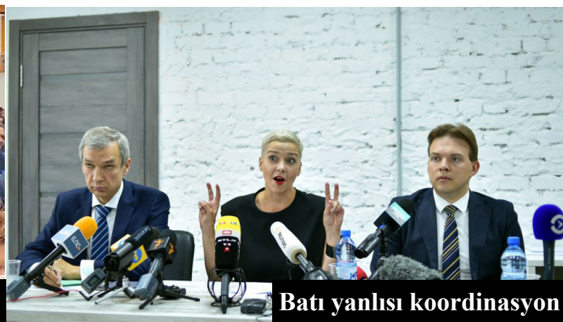
Batı yanlısı koordinasyon