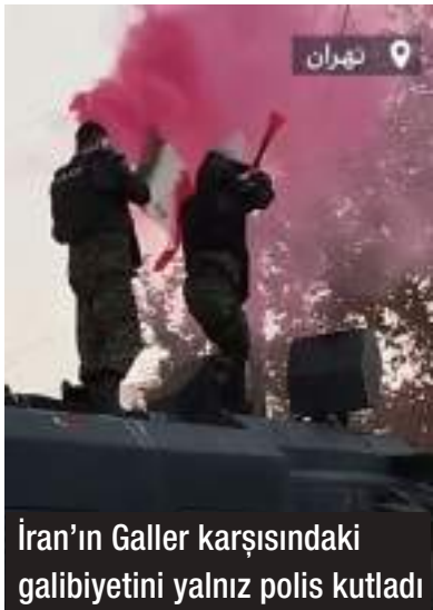
İran'ın Galler karşısındaki galibiyetini yalnız polis kutladı

İran'ın futbol dünya kupasında Amerika ile oynadığı maçı kaybetmesinden sonra halkın sokaklarda sevinç gösterisinde bulunması, emperyalizm yanlısı medyada halkın rejime karşı isyanının Amerika yanlısı olduğuna kanıt olarak gösterildi. Bu baştan aşağı yanlıştır. Halkın