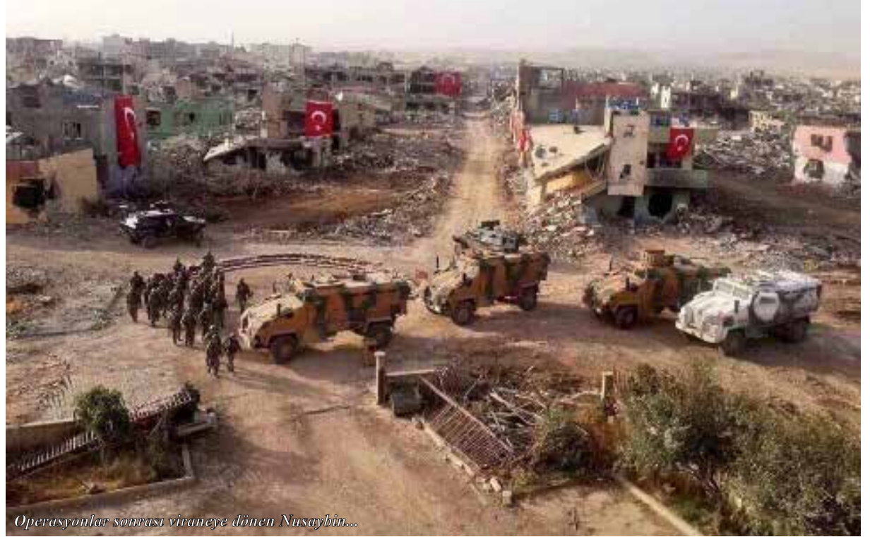
Operasyonlar sonrası vuraneye dönen Nusaybin...

Türkiye'nin son dönem tarihinde üç büyük toplumsal olaydan biri olan (ötekiler Gezi ile başlayan halk isyanı ve 2015 büyük fiili metal grevi) 6-12 Ekim serhildanı (isyani), AKP hükümetinde büyük korkuya yol açmıştı. 24 Ekim'de, olayın üzerinden daha 15 gün bile geçmeden, partisinin Ege ve Akdeniz bölgeleri milletvekilleri ile kapalı bir toplantıda bir araya gelen o dönemin başbakanı Ah-