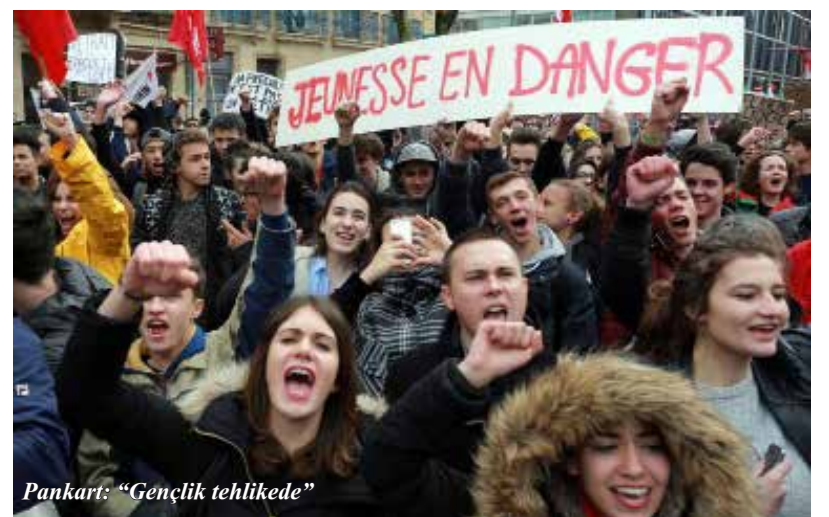
Pankart: "Gençlik tehlikede"