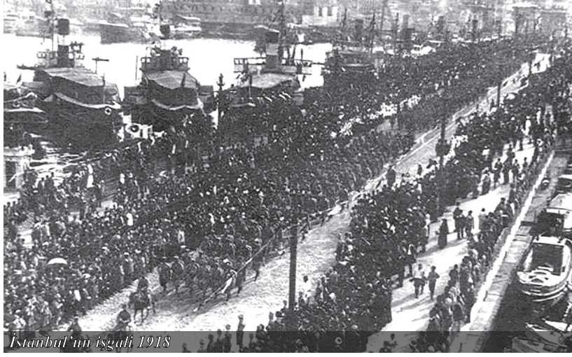
İstanbul’un işgali 1918

Tarihi çarpıtma sanatı iyice gelişti. Geçmişte “resmi tarih” vardı, şimdi de “karşı resmi tarih” geldi. Tayyip Erdoğan İstanbul’u fethettiği için Osmanlı’yı yüceltiyor. Uygarlıkların nasıl olduğundan bihaber bir bağınazlığın resmidir bu yaklaşım. Osmanlı Konstantiniyye’yi fethettiği kadar Bizans da Osmanlı’yı fethetmiştir. Bugünkü Anadolu halkları, sadece Türk-İslam uygarlığının değil, Hitit, antik Yunan, Truva, Bizans uygarlıklarının, Horasan dervişlerinin ve Balkan halklarının hepsinin ortak ürünüdür. Bağnazlığın akli sadece İslam’ın Hıristiyanlığı kılıçla fethetmesindedir. Oysa Bizans’ın