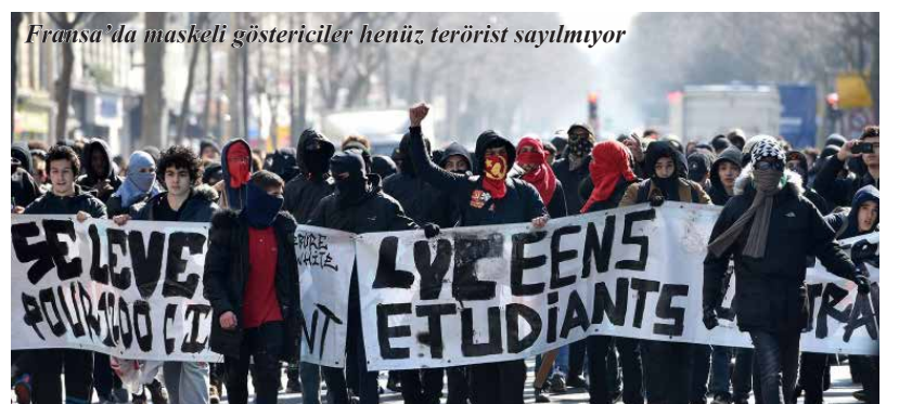
Fransa'da maskeli göstericiler henüz terörist sayılmıyor